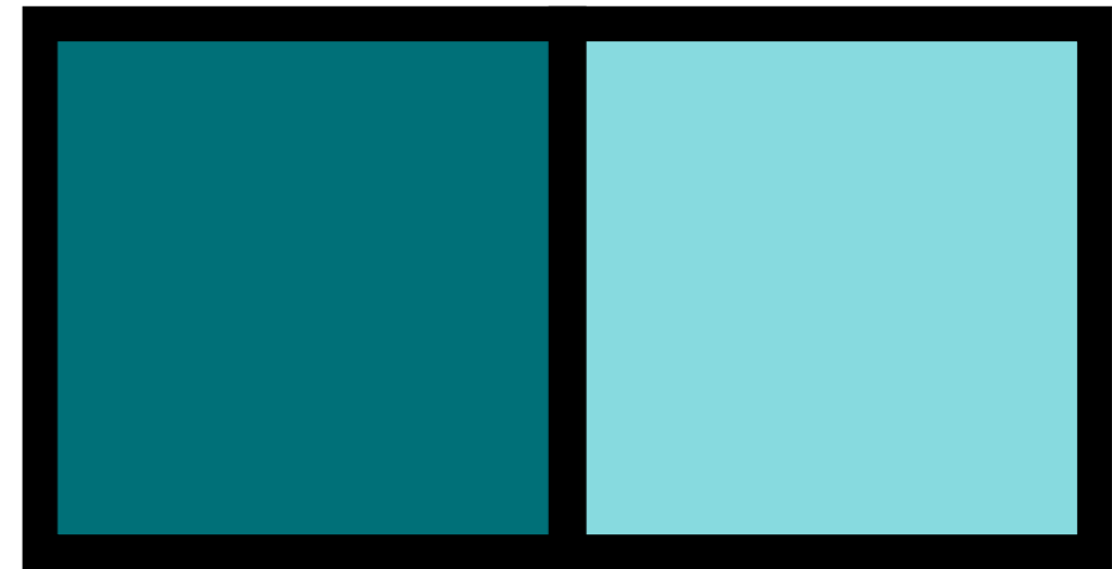
PANTONE 322 C